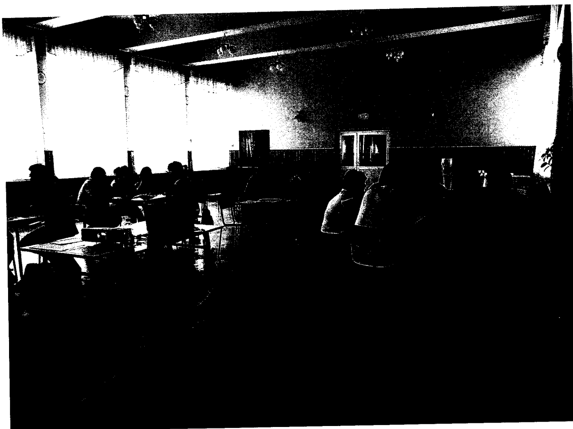
Sala w GOK w Kańczudze.

Siedleczka wieś w niecce Nieteczy zapewniająca godne warunki życia mieszkańcom dbającym o młode pokolenie i kultywującym tradycje przodków dzięki nowoczesnej infrastrukturze społecznej.